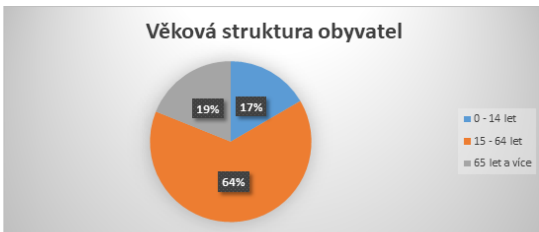
Obrázek č. 1 : Věkové rozložení obyvatel v obci Račice k 31. 12. 2019

Aktuální počet obyvatel obce je 344 (k 31. 12. 2019). Počet obyvatel obce je poměrně stabilní. Od roku 2011 vzrostl počet obyvatel o 25. Na přírůstek obyvatel má vliv zejména počet přistěhovalých. V roce 2011 bylo v Račicích 125 domácností. Podíl dětí do 15 let dosáhl v roce 2019 hodnoty 17 %. Lidí v ekonomicky aktivním věku žije v obci 64 %. Průměrný věk obyvatel se drží okolo 42 let. V obci žije 46 % mužů a 54 % žen.